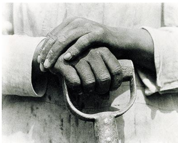
Mains appuyées sur un outil - 1927